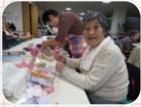
↑今花びらを作っているよ