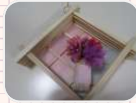
割りばしの枠に乗せて完成！