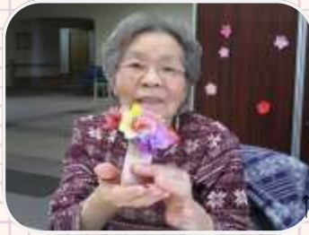
↑できたよ！きれいでしょ？