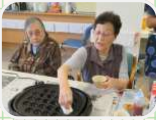
↑やけどしないようにね!

9月デイサービスはおやつ作りを行いました。今回は、たこ焼き器を使用して鈴カステラ風のおやつを作りました。利用者さんが生地を混ぜられたり、ホットプレートに生地を流したりする際がとても良いことに驚きました。皆さんおいしそうに召し上がられていました。