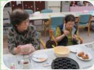
↑夢中になって食べてます