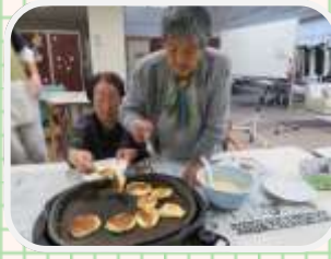
↑手際よく焼いています