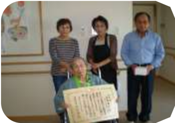
「ご家族と記念撮影」 → ↓

お客様相談窓口 賢持 堀合 でんわ 48・1777 FAX 49・7337 メールでも受け付けています。 k-turedure1@wing.ocn.ne.jp