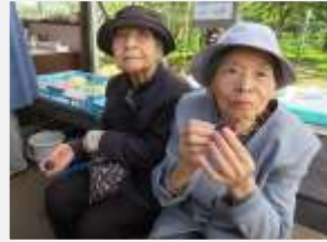
↑プルーンおいしい!

十月フェイスサービスは、秋の紅葉ドライブに出掛けてきました。行き先は七飯町の「都築果物農園」と「道の駅なないろ・ななえ」に行ってきました。果物農園では果物の試食をさせて頂いたり、実際にリンゴやプルーン等を買われた利用者さんもあり、秋のひとときを楽しみました。