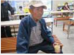
↑道の駅でお買い物したよ!