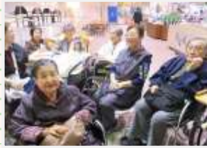
↑皆さん楽しんでますか?!