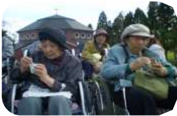
トラピスト修道院前で↑

の熱帯植物をみて楽しみました。さらに立待岬まで足を伸ばし絶景をみて帰路に着きました。お天気にも恵まれ、楽しい外出となりました。また、三條館は、十月十五日に「トラピスト修道院」に行ってきました。厳肅な空気が漂う中でアイスクリームを食べてきました。自然の中で食べるアイスクリームは格別です。その後、売店にも足を運び、トラピストクッキー、バター飴やトラピストバターなどをみて、「あら、おいしいぞう」「このバターをパンにつけて食べたらおいしいんだよー」など会話も弾みました。来年もまた一緒に行きましょーね。